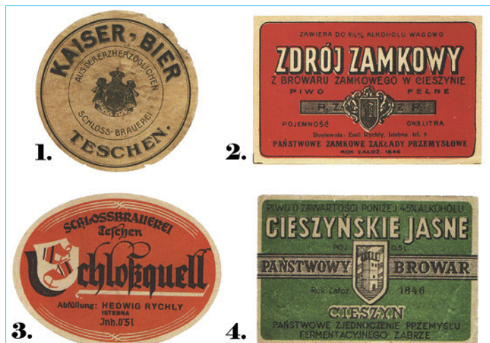
Etykiety zamkowych piw typu lager z lat: 90. XIX w. (1), 30. XX w. (2), 1939-1945 (3), 40/50 XX w. (4).