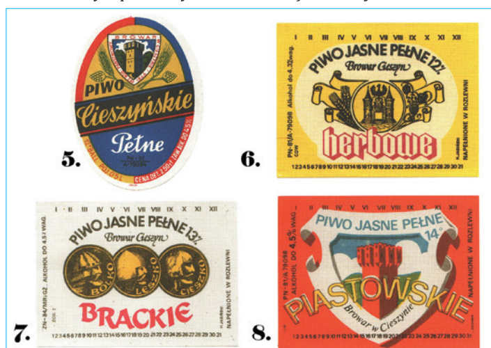
Etykiety zamkowych piw typu lager z lat: 60. XX w. (5), 80. XX w. (6-8).

teresowany losem przedsiębiorstwa. Przez to, utratę rynków zbytu w dawnych Austro-Węgrzech i na Zaolziu oraz kryzys gospodarczy przekładający się na ogólny spadek popularności piwa, produkcja zmalała o kilkadziesiąt procent. Stale było ono jednak obecne w życiu mieszkańców nadolziańskiego grodu – ponoć szczególnie cenili je sobie żołnierze 4. Pułku Strzelców Podhalańskich. Zrezygnowano z herbu z arcyksiążęcą koroną, obierając za nowy znak Wieżę Piastowską, która nieprzerwanie – aż do dzisiaj – widnieje w logo zakładu. Wśród wielu dzierżawców przedsiębiorstwa pojawił się podobno nawet krewniak ówczesnego prezydenta Ignacego Mościckiego. Ostatnim przedwojennym dyrektorem browaru był Marian Kiwerski, najwybitniejszy badacz dziejów piwowarstwa w dwudziestoleciu międzywojennym i autor klasycznego opracowania na ten temat. Sztandarowym piwem był wówczas Zród Zamkowy .